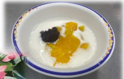
ココナツミルクぜんざい (チエー)