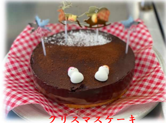
クリスマスケーキ (チョコムースケーキ)