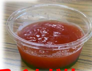
七夕そうめん♡ スイカゼリー♡