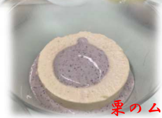
栗のムース 黒豆ソースがけ